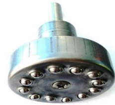
Fig.1.1 Cap de netezit