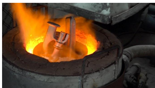
Fig. 5. Topirea aluminiului

3.4. Odată ajuns în stare lichidă, aluminiul este turnat în canalele de turnare ale formei.