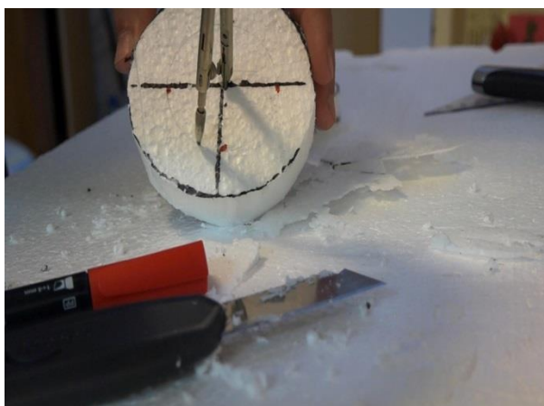
Fig. 2. Realizarea modelelor

3.2. Pentru a permite eliminarea gazelor din formă și evitarea apariției suflurilor, porozitaților se impune ca permeabilitatea la gaze a amestecului să fie mare (180-200 unitati). În acest scop, formele se prevăd cu aerisiri suplimentare.