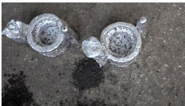
Fig.8. Răcirea pieselor

3.6. Așteptarea răcirii complete a pieselor la temperatură ambiantă (în cazul răcirii sub jet de apă rece sau expunerii la o temperatură joasă, piesele proaspăt turnate pot sparge).