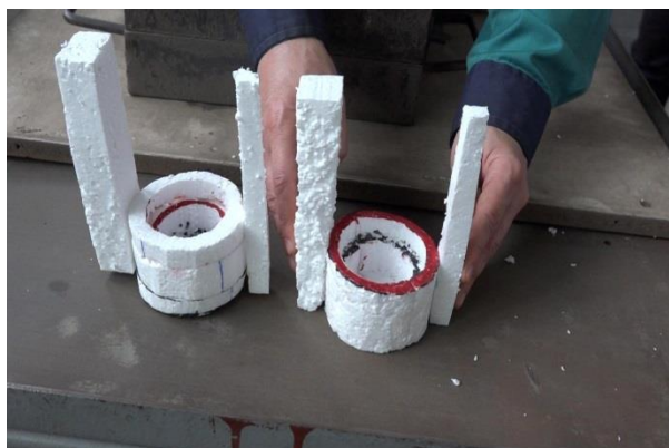
Fig. 3. Canale de turnare și aerisiri

3.2. Pentru a permite eliminarea gazelor din formă și evitarea apariției suflurilor, porozitaților se impune ca permeabilitatea la gaze a amestecului să fie mare (180-200 unitati). În acest scop, formele se prevăd cu aerisiri suplimentare.