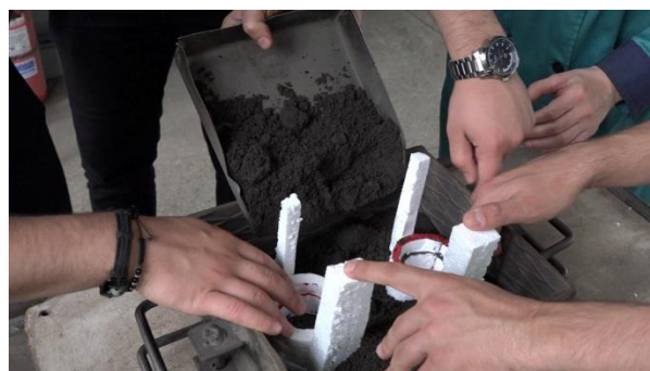
Fig. 4. Așezarea în ramă a matritelor

3.3. Punerea amestecului de formare în rame, timp în care aluminiul este topit în cuptor.