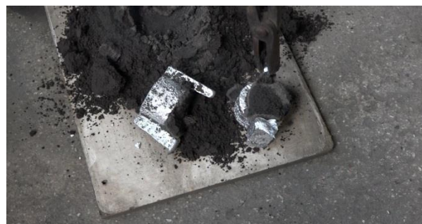
Fig. 7. Scoaterea formelor din amestec

3.5. Aluminiul începe să se răcească iar formele turnate pot fi extrase din amestecul de formare.