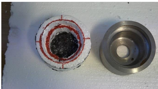
Fig. 1. Modele din polistiren

magnetic, compactarea făcându-se doar prin vibrare.